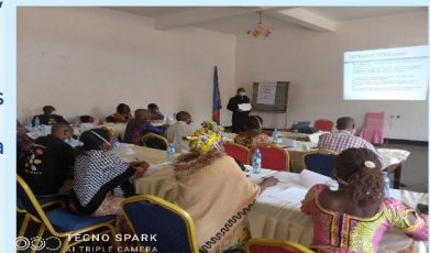
Séance de formation sur les VBG organisée au Nord Kivu par SAFDF