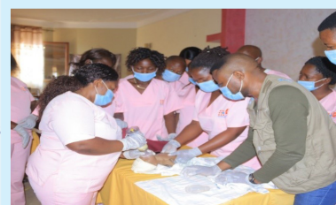
Séance de formation pratique des sages-femmes humanitaires à Bunia